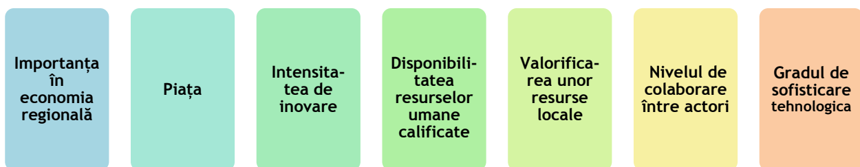
Figura 1. Criterii folosite pentru analiza domeniilor selectate

Analiza propriu-zisă este structurată pe șapte criterii considerate relevante pentru evaluarea potențialului domeniului de a deveni specializare inteligentă în regiune, respectiv: importanța domeniului în economia regională, piața, intensitatea de inovare în domeniu, disponibilitatea resurselor umane calificate în domeniu, valorificarea unor resurse locale (altele decât cele umane, dacă este cazul), nivelul de colaborare între actorii din domeniu, gradul de sofisticare tehnologică.